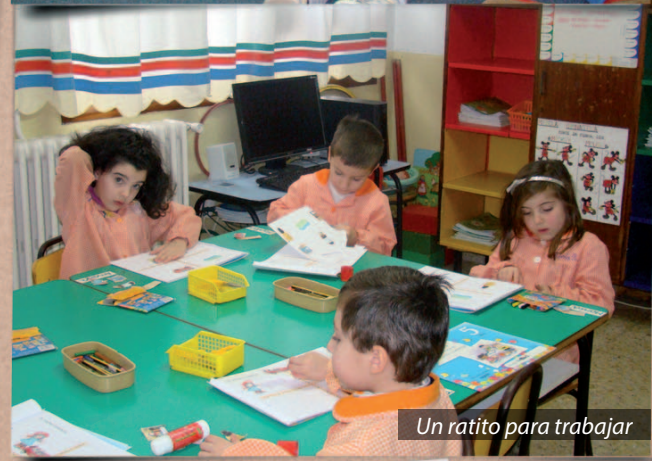
...y algunas sorpresas